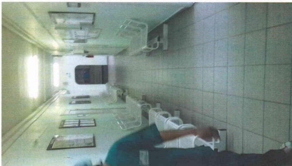
Фото 14. Дверь.

Пути движения внутри здания (в т.ч. путей эвакуации)