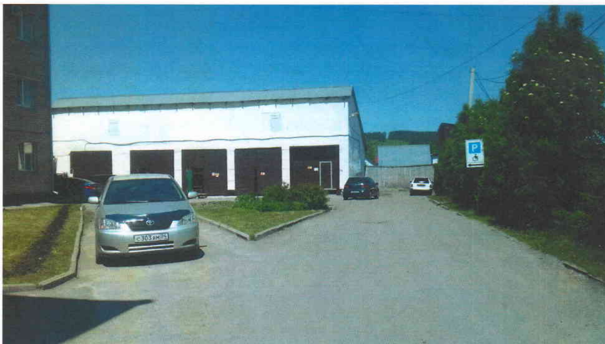
Путь (пути) движения на территории.