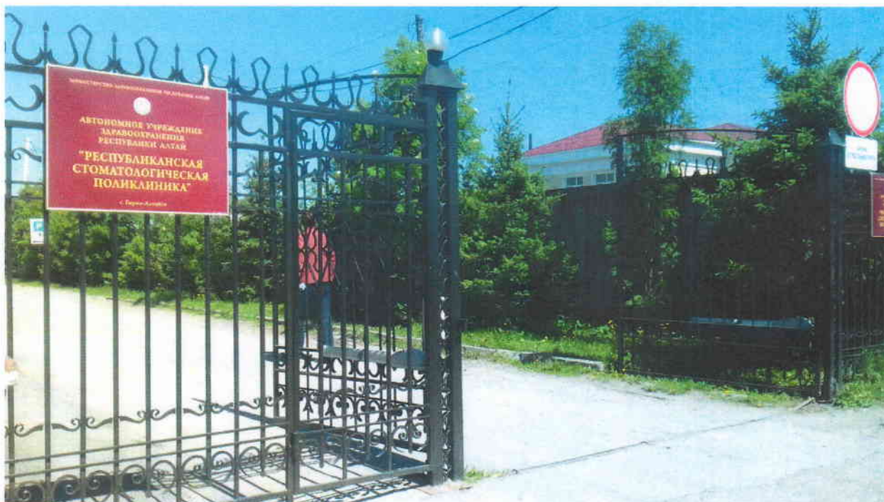
Фото 2. Вход (входы) на территорию.