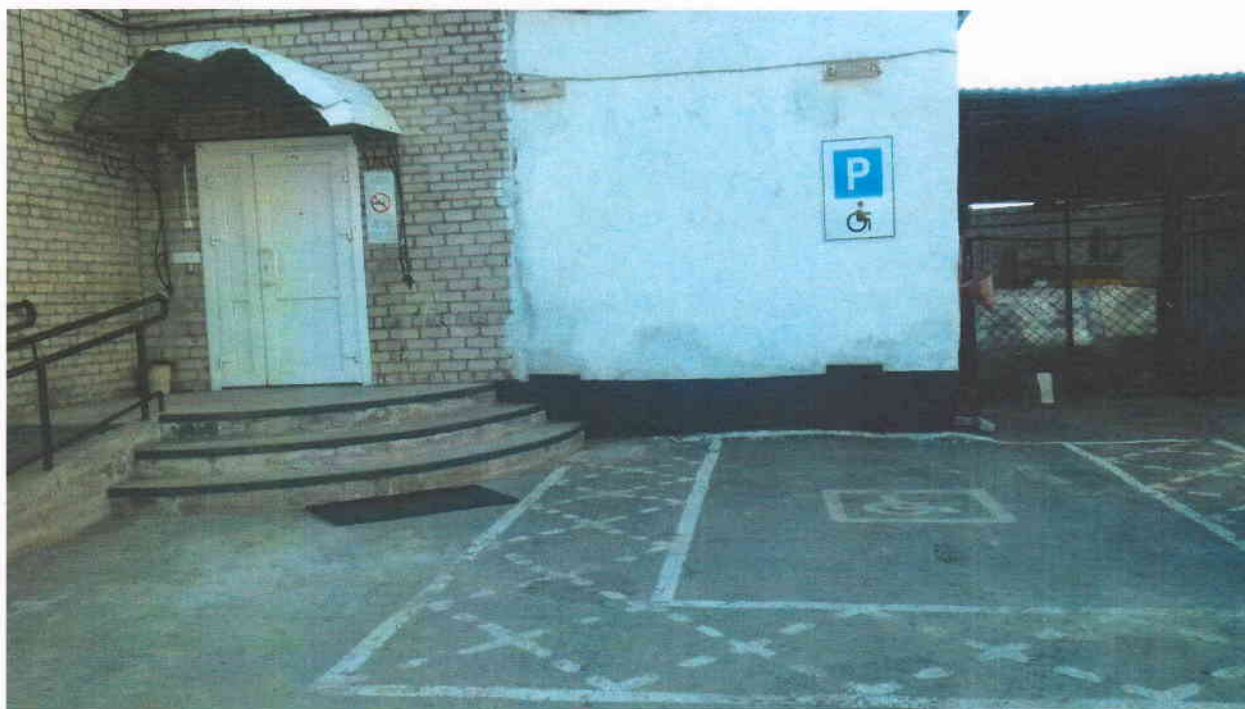
Фото 6. Лестница (наружная) Дверь (входная). Пандус (наружная).