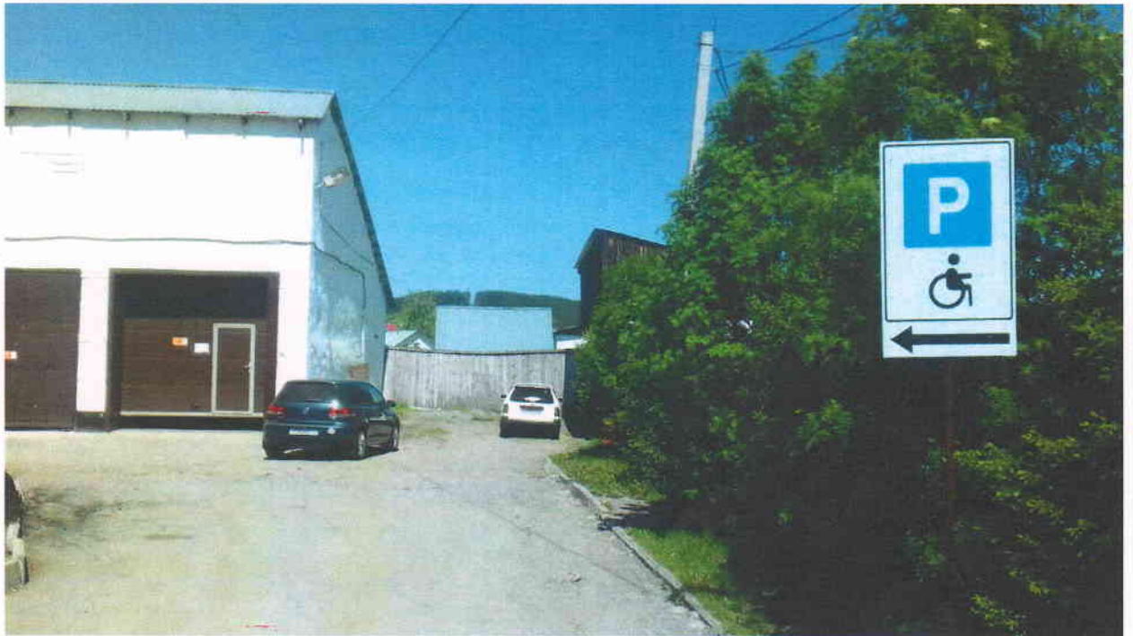
Фото 4. Путь (пути) движения на территорию.